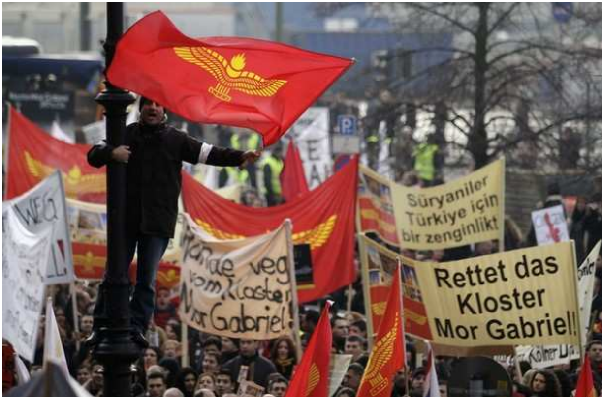
foto van de demonstratie in Berlijn

De raad van Europa heeft op 29 januari 2009 een nieuwe resolutie aangenomen, waarin zij een oproep doet aan de Turkse autoriteiten om het grondeigendom van belangrijke religieuze, culture erfgoed en gebedsplaatsen NIET te onteigenen onder valse voorwendselen met onomkeerbare gevolgen.