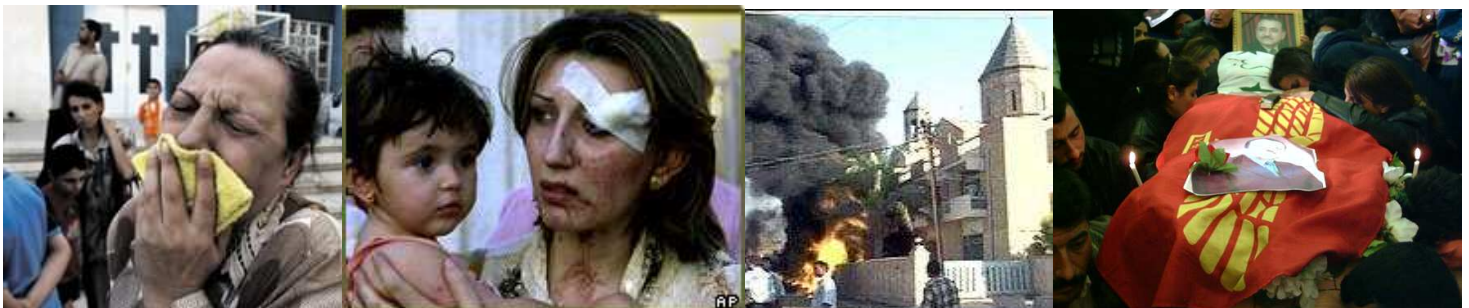
(BBC, Reuters, AFP, CNN)

Dit gevecht om Nineve onttrekt zich grotendeels aan de internationale bemoeienis met Irak. Het Amerikaanse leger heeft zich in de loop van 2009 grotendeels uit deze regio teruggetrokken terwijl de aanwezige VN-instanties tamelijk machteloos proberen om de verschillende bevolkingsgroepen tot elkaar te brengen. Naarmate deze strijd blijft doorgaan, zullen met name de minderheden als Aramese christenen in dit gebied het slachtoffer worden.