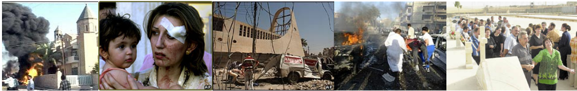
(BBC; Reuters, AFP; CNN)

De situatie van de Arameeërs in Irak is waarschijnlijk het meest schrijnend van alle volkeren in Irak. Sinds de invasie van de Amerikaanse troepen en hun bondgenoten hebben reeds 800.000 Arameeërs (in Irak ook wel bekend als Syriërs (Syriacs), Chaldeeërs of Assyriërs), die de inheemse bewoners van Mesopotamië zijn, het gebied verlaten. Velen zoeken hun toevlucht in Syrië en Jordanië of westerse landen.