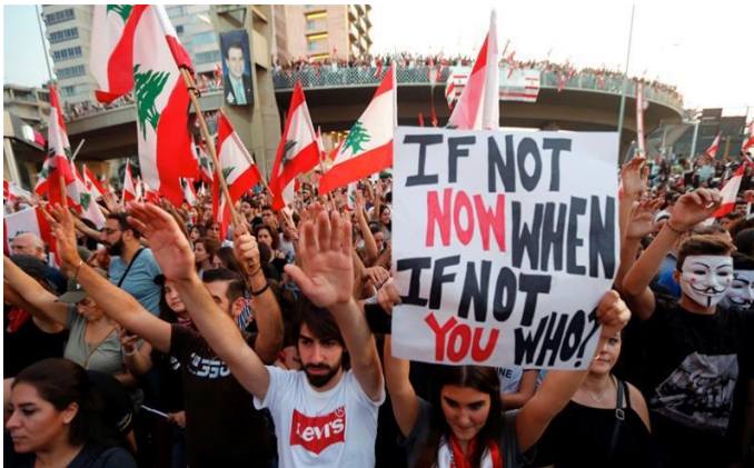
Straatprotesten tegen de regering