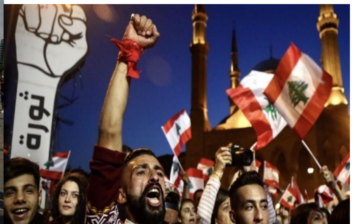
De geheven vuist die al een paar keer is vernield