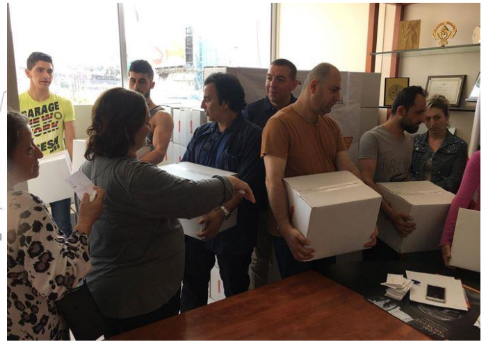
uitdelen van voedselpakketten aan vluchtelingen