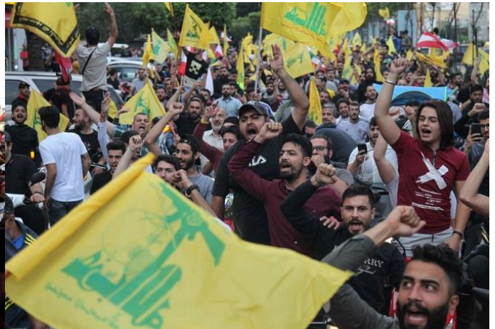
Tegendemonstraties van Hezbollah