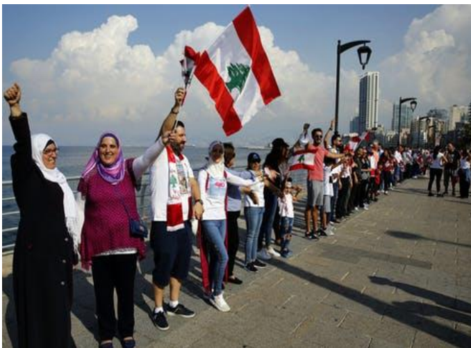
Menselijke keten van noord naar zuid Libanon